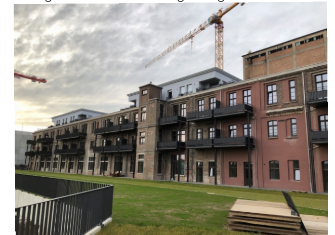
MainAnker - Quartier auf dem Areal der ehemaligen Phrix-Papierfabrik

Im Rahmen der Neuaufstellung des regionalen Flächennutzungsplans hat die Stadt Hattersheim, aufgrund der anhaltend starken Nachfrage, Flächen für künftige Gewerbeentwicklungen angemeldet.