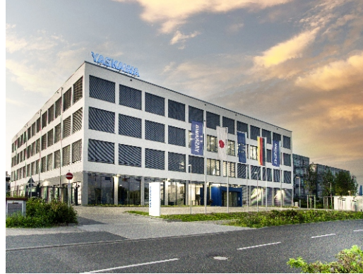
YASKAWA Europe GmbH

Hattersheim am Main ist ein Wirtschaftsstandort mit ausgezeichneten Perspektiven.